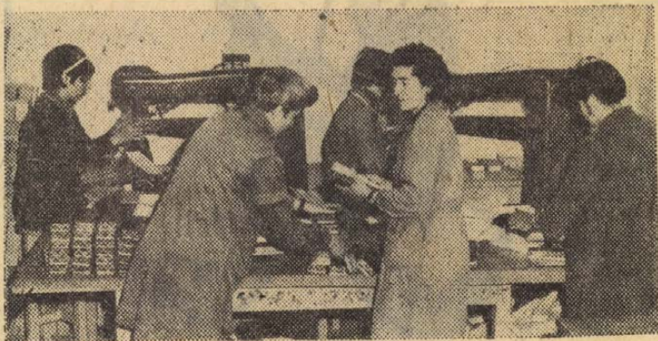
Havonta 50 tonna papírt dolgoz fel a dobozüzem

nyers és igényesebb kivitelben, a legkülönbözőbb célokra (papucs, cipő, ing, játék csomagolására). Fűzött és stancolt dobozok.