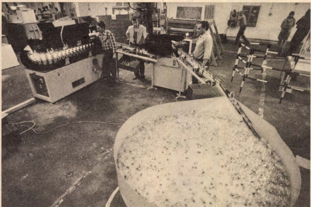
Az Egyesült Izzó Gépjármű Intézetétől a Westinghouse cég kanadai vállalata tavaly decemberben rendelte meg a hagyományostól eltérő lámpafeliratózó és minőségellenőrző automata gépsorokat, amelyek most elkészültek. A két gépsor egyenként és óránként hétézer lámpát feliratózó és ellenőrző kezelő felügyeletével. A képen: próbauzem átadás előtt